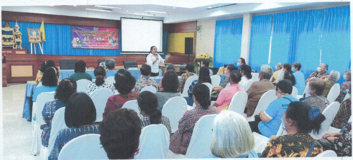
การบรรยายให้ความรู้เรื่อง การส่งเสริมอาชีพให้กับผู้สูงอายุ และการใช้เวลาว่างให้เป็นประโยชน์