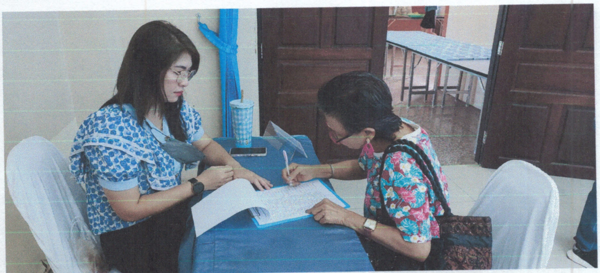
การรับลงทะเบียน