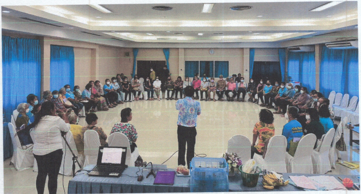
ผู้เข้าร่วมโครงการฯ