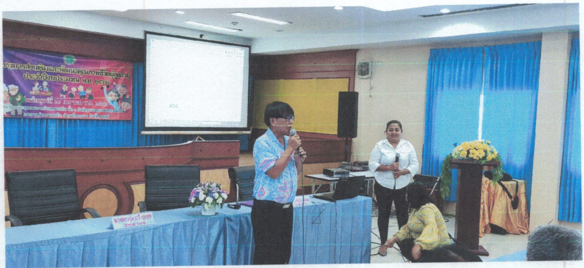
การบรรยายให้ความรู้เรื่อง สุขอนามัยพื้นฐาน ๙ ข้อ ในการดูแลสุขภาพผู้สูงอายุ, สิทธิประโยชน์ที่ผู้สูงอายุได้รับตามพระราชบัญญัติผู้สูงอายุ พ.ศ. ๒๕๔๖, การป้องกันโรคในผู้สูงอายุ, โภชนาการ และการออกกำลังกายที่เหมาะสมกับวัยผู้สูงอายุ