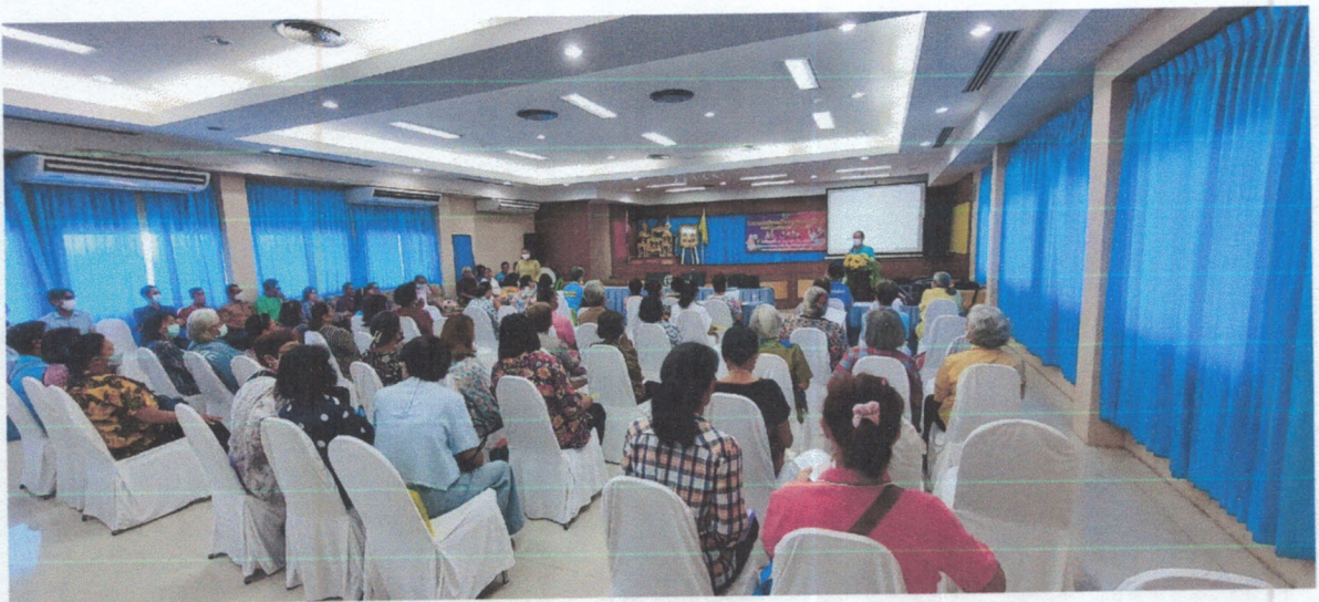
ผู้เข้าร่วมโครงการฯ