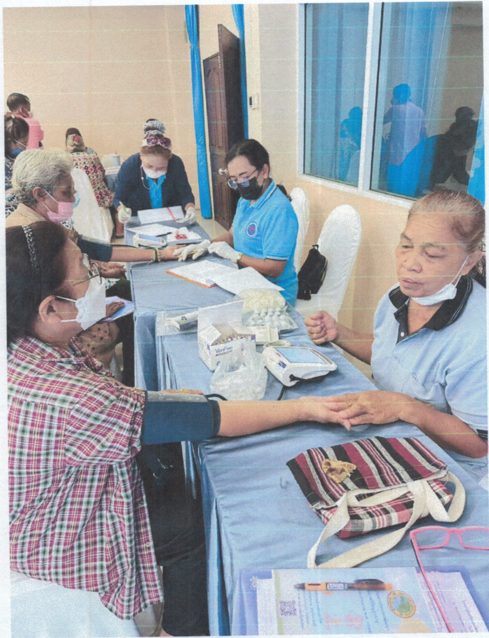
ตรวจคัดกรองสุขภาพเบื้องต้น (วัดความดัน ตรวจเลือด)