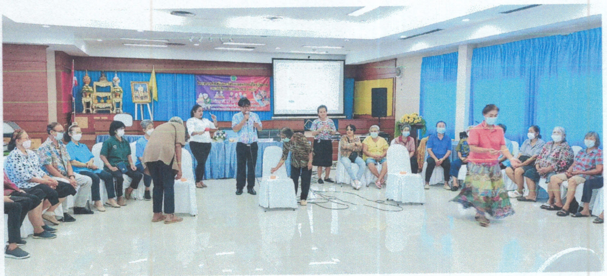
กิจกรรมสร้างสุขของผู้สูงอายุ ความสุข ๕ ด้าน คือ สุขสบาย, สุขสนุก, สุขสง่า, สุขสว่าง และสุขสงบ