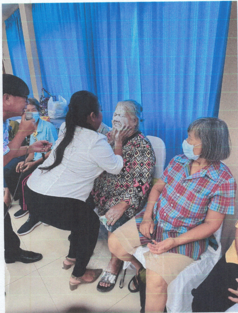
กิจกรรมสร้างสุขของผู้สูงอายุ ความสุข ๕ ด้าน คือ สุขสบาย, สุขสนุก, สุขสง่า, สุขสว่าง และสุขสงบ