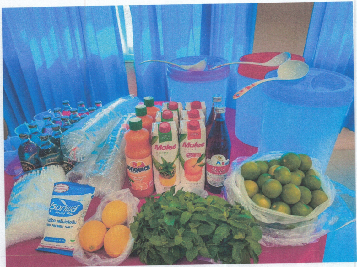
การฝึกปฏิบัติอาชีพ “การทำน้ำพืชน์”