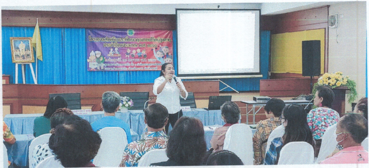
การบรรยายให้ความรู้เรื่อง การส่งเสริมอาชีพให้กับผู้สูงอายุ และการใช้เวลาว่างให้เป็นประโยชน์