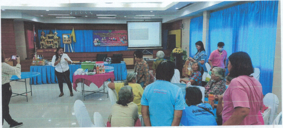
การฝึกปฏิบัติอาชีพ “การทำน้ำพืชน์”